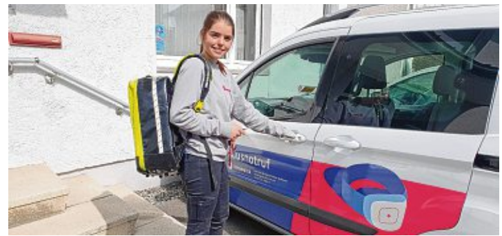
FSJler haben bei den Johannitern vielfältige Einsatzmöglichkeiten.