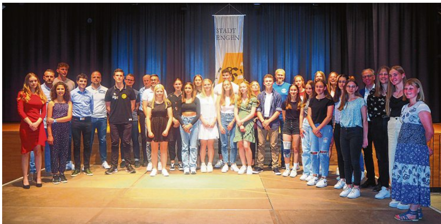
Trotz Corona, Trainingspausen und Wettkampfausfällen konnten die Engener SportlerInnen beachtliche Erfolge erzielen. Bei der Sportlerehrung am vergangenen Freitagabend wurden rund 60 AthletInnen dafür geehrt.