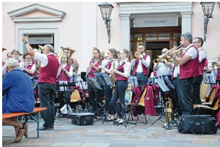
Am 2. Juni beginnen die beliebten Feierabendkonzerte auf dem idyllischen Marktplatz in Engen. Zum Auftakt spielt der Musikverein Barga.

der Musikverein Barga für gute Stimmung. Die Bewirtung übernimmt an diesem Abend die Stadtmusik Engen. Die weiteren Termine sind am 23. Juni mit der Stadtmusik Engen , am 30. Juni mit dem Musikverein Anselfingen , am 14. Juli mit dem Musikverein Zimmerholz und am 28. Juli mit dem Musikverein Welschingen . Die Organisatoren freuen sich, viele Engener Bürger, Urlaubsgäste und Firmen mit ihren Mitarbeitern zu den Feierabendhocks auf dem Marktplatz begrüßen zu dürfen. Die Feierabendkonzerte finden nur bei guter Witterung statt.