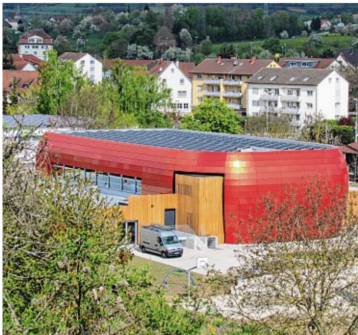
Auch für die im Frühjahr 2014 eingeweihte neue Stadthalle mit ihrer markanten Form und Farbe soll im Rahmen des Wettbewerbs ein Name gefunden werden.